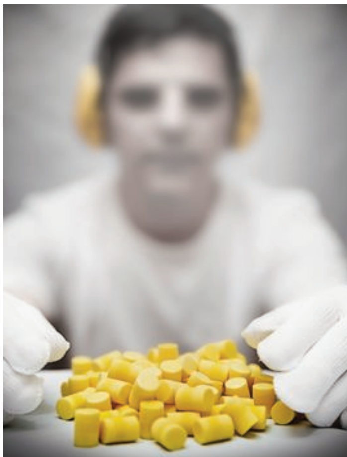
PREMIO A LA MEJOR FOTOGRAFIA ARTISTICA: IVAN MARTIN TÍTULO DE LA FOTOGRAFÍA: "EPI"