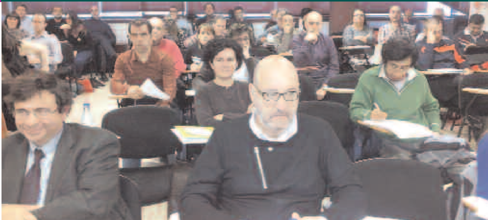
Delegados y Delegadas de Prevención de Riesgos Laborales durante la jornada organizada por el sindicato en la sede de UGT en Bilbao