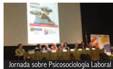
Jornada sobre Psicología Laboral