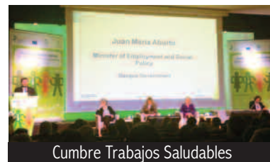
Cumbre Trabajos Saludables