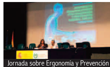
Jornada sobre Ergonomía y Prevención

El trabajo de campo del Observatorio de Riesgos Psicosociales de UGT indica que el 75% de los trabajadores presenta estrés originado en la mayoría de los casos por unas deficientes condiciones de trabajo. El 87% de los trabajadores encuestados reconocen tener una carga mental alta en su trabajo por carecer de autonomía al realizar sus tareas, el 76% por no tener definido el rol y el 71% siente inseguridad respecto a las condiciones de su trabajo y al futuro de su carrera.