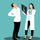
Enfermedades relacionadas con el trabajo, no incluidas como enfermedad profesional